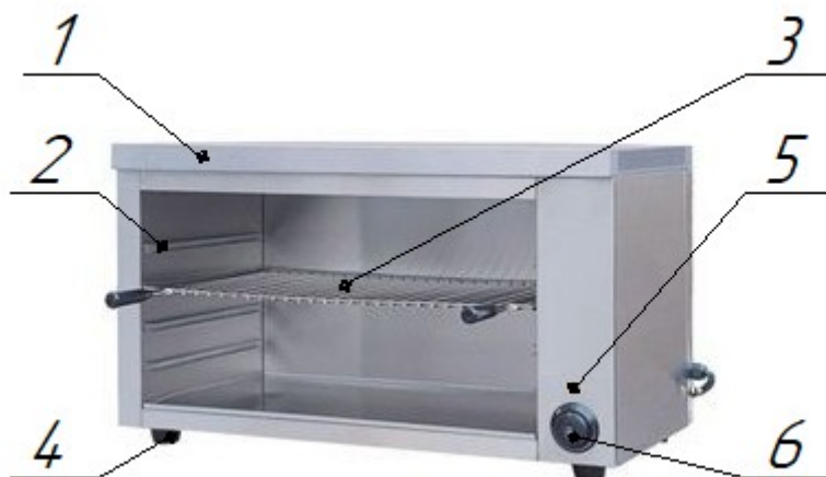
Рис.1. Общий вид гриля электрического типа «САЛАМАНДРА СА-3»